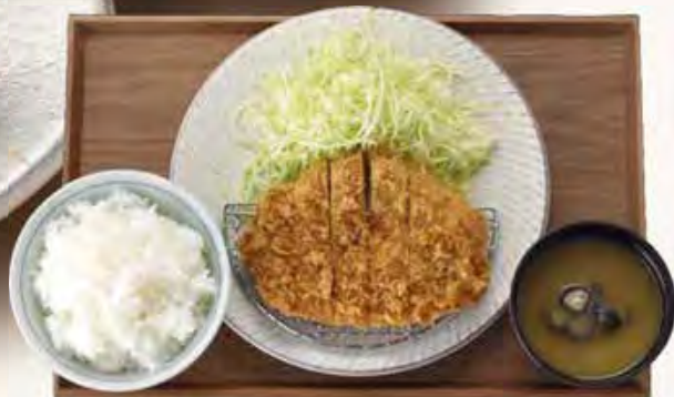
ご飯・しじみ汁付き