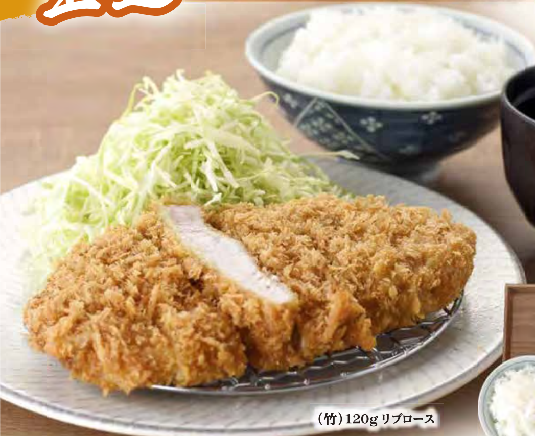
(竹) 120g リブローズ