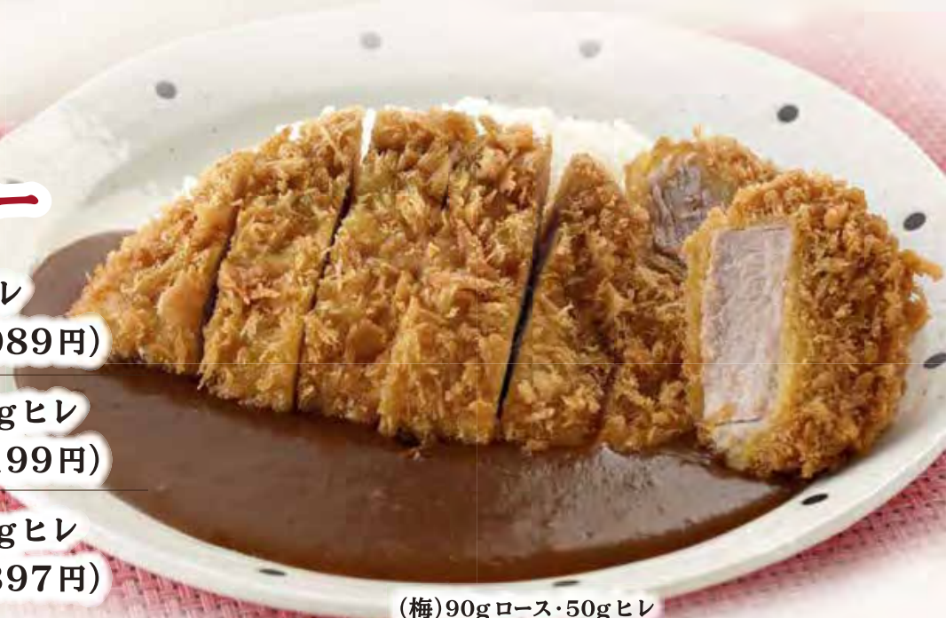
(梅)90g ロース・50g ヒレ