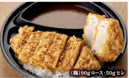
(梅)90g ロース・50g ヒレ