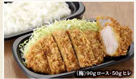
(梅)90g ロース・50g ヒレ