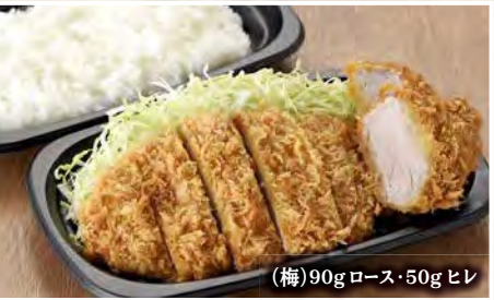
(梅)90g ロース・50g ヒレ