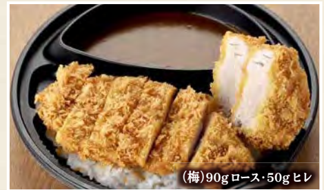
(梅)90g ロース・50g ヒレ