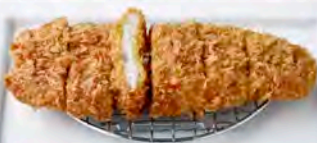
単品 90g ロースかつ 460円(税込506円)