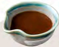
ちよいがけカレー 150円(税込165円)