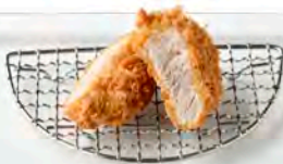
単品 ヒレかつ 290円(税込319円)