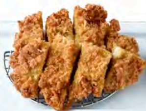
単品 ジャンボチキンかつ 490円(税込539円)