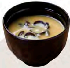
しじみ汁 110円(税込121円)