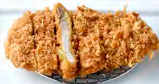
単品 120g リブローズ 560円(税込616円)