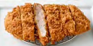
単品 170g リブローズ 760円(税込836円)