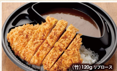
(竹) 120g リブローズ

(梅) 90g ロース・50g ヒレ / 1,080円 (税込1,166円) (竹) 120g リブローズ・50g ヒレ / 1,180円 (税込1,274円) (松) 170g リブローズ 50g ヒレ / 1,380円 (税込1,490円)