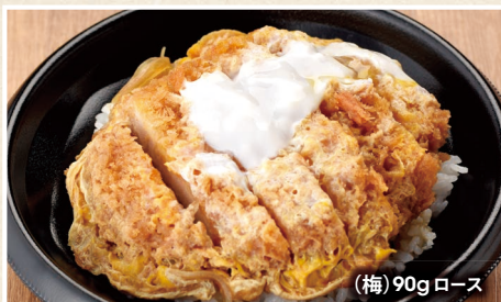
(梅) 90g ロース