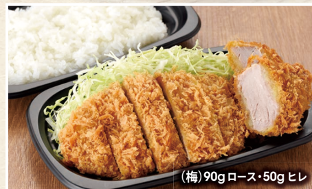
(梅) 90g ロース・50g ヒレ