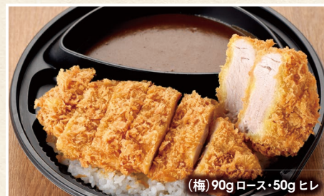
(梅) 90g ロース・50g ヒレ