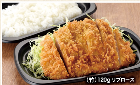
(竹) 120g リブローズ