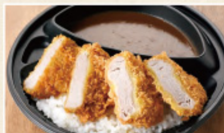
ヒレかつカレー弁当

(梅)90g ロース / 880円(税込950円) (竹)120g リブロース / 980円(税込1,058円) (松)170g リブロース / 1,180円(税込1,274円)