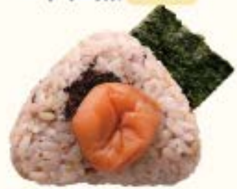
十六穀米 南高梅 260円