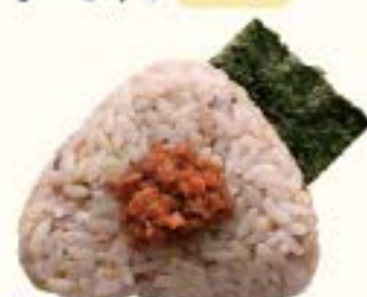
十六穀米 鶏そぼろ 210円