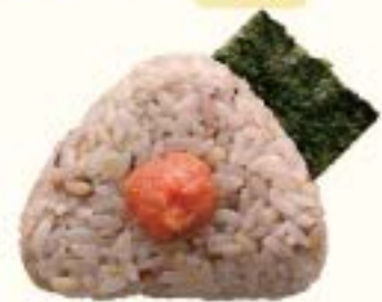
十六穀米 明太子 270円