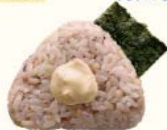
十六穀米 ツナマヨ 210円