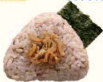
十六穀米 ちりめん山椒 270円